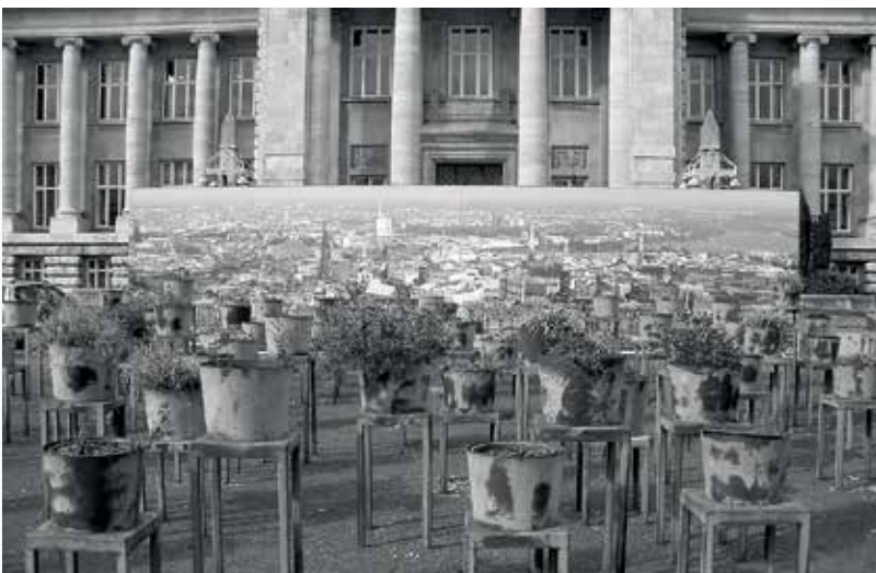
Vor dem Strafjustizgebäude erinnert die Installation »Hier + Jetzt« der Künstlerin Gloria Friedman von 1997 an die Opfer nationalsozialistischer Justiz.

Und Sie haben ihn dabei unterstützt. Sie haben sich vor ihn gestellt, als er ein Spiel eingesteckt hat. Das ist schon überlegt. Nach Zufall sieht das nicht aus. Sie haben sich gegenseitig gedeckt, deshalb konnte der Ladendetektiv auch nichts sehen. [Michael druckst herum.] Und dann hat der Ladendetektiv Sie angehalten. Wie war das denn