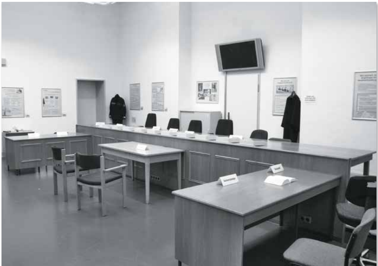
Im DOGS-Saal befinden sich auch Ausstellungsstücke aus der Hamburger Untersuchungshaftanstalt wie ein Drogenschmuggelschuh oder ein improvisiertes Tätowiergerät. Hinzu kommen bebilderte Interviews mit Strafgefangenen, in denen sie offen über ihre Taten, die Zeit im Gefängnis und ihre Hoffnungen für die Zukunft sprechen.

Amtsgericht Hamburg DOGS – Der Offene Gerichtssaal Saal 201a Sievekingplatz 3 (Strafjustizgebäude) | 20355 Hamburg E-Mail: dogs@ag.justiz.hamburg.de Öffnungszeiten: zu erfahren per E-Mail oder per Telefon unter 040 42842-2345